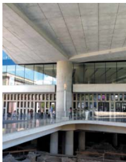
Le Musée de l'Acropole

Dans la matinée du 18 mai, nous nous dirigeons vers le Nord dans ce surprenant paysage des Météores , rochers aux formes bizarres aux sommets desquels des moines fondèrent des monastères au XIVe siècle.