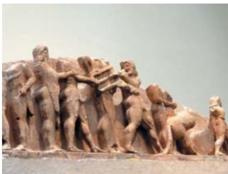
Dispute entre Héraclès et Apollon 525 avant J.C.

Le sanctuaire d'Apollon se situe dans un beau décor naturel. Le site a été restauré à l'occasion des Jeux Olympiques de 2004.