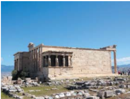
L'Erechthéion et les Caryatides

Et, bien sûr, le Parthénon, qui abritait une énorme statue d'Athéna, en or et en ivoire, dont il ne reste rien.