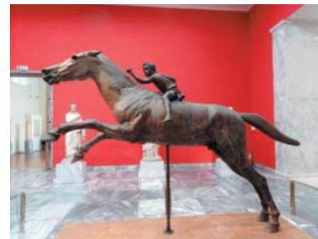
Le petit jockey, bronze découvert au fond de la mer (Cap Artémision)